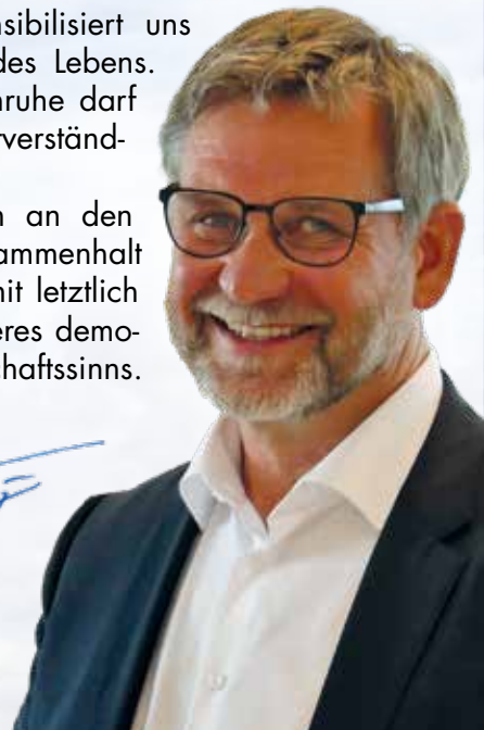
Karl-Heinz Fitz Erster Bürgermeister