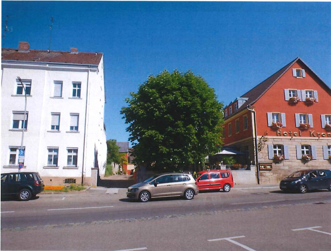
Abb. 7: Blick von der Nürnberger Straße Richtung Norden