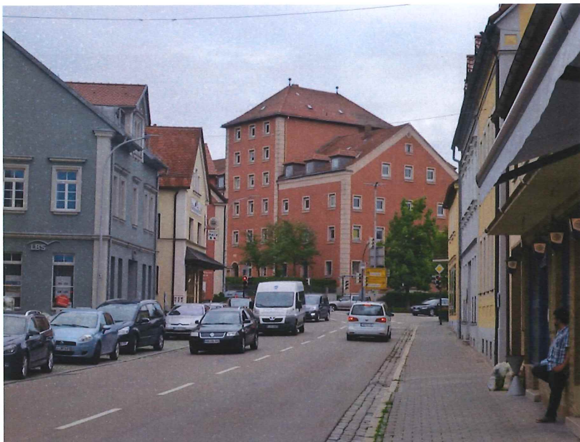
Abb. 5: Blick von der Bahnhofstraße Richtung Norden auf das Haus "Silo"