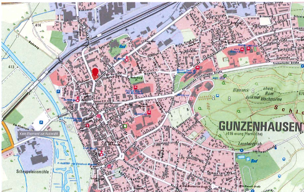
Abb. 1: Lageplan (ohne Maßstab)

Das Planungsgebiet ist leicht nach Süden geneigt, das Gelände fällt von 422,5 NHN im Norden auf 418,5 NHN im Süden.