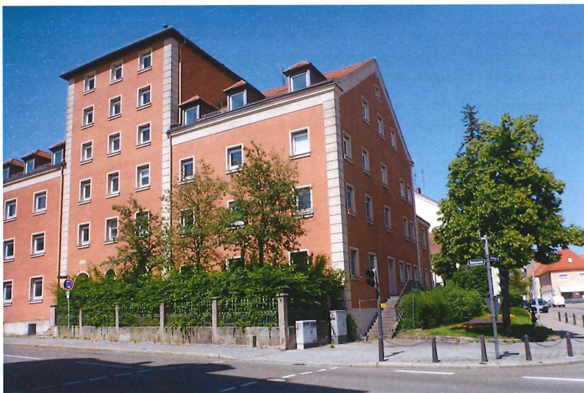
Abb. 6: Blick von der Bahnhofstraße Richtung Osten auf das Haus "Silo"