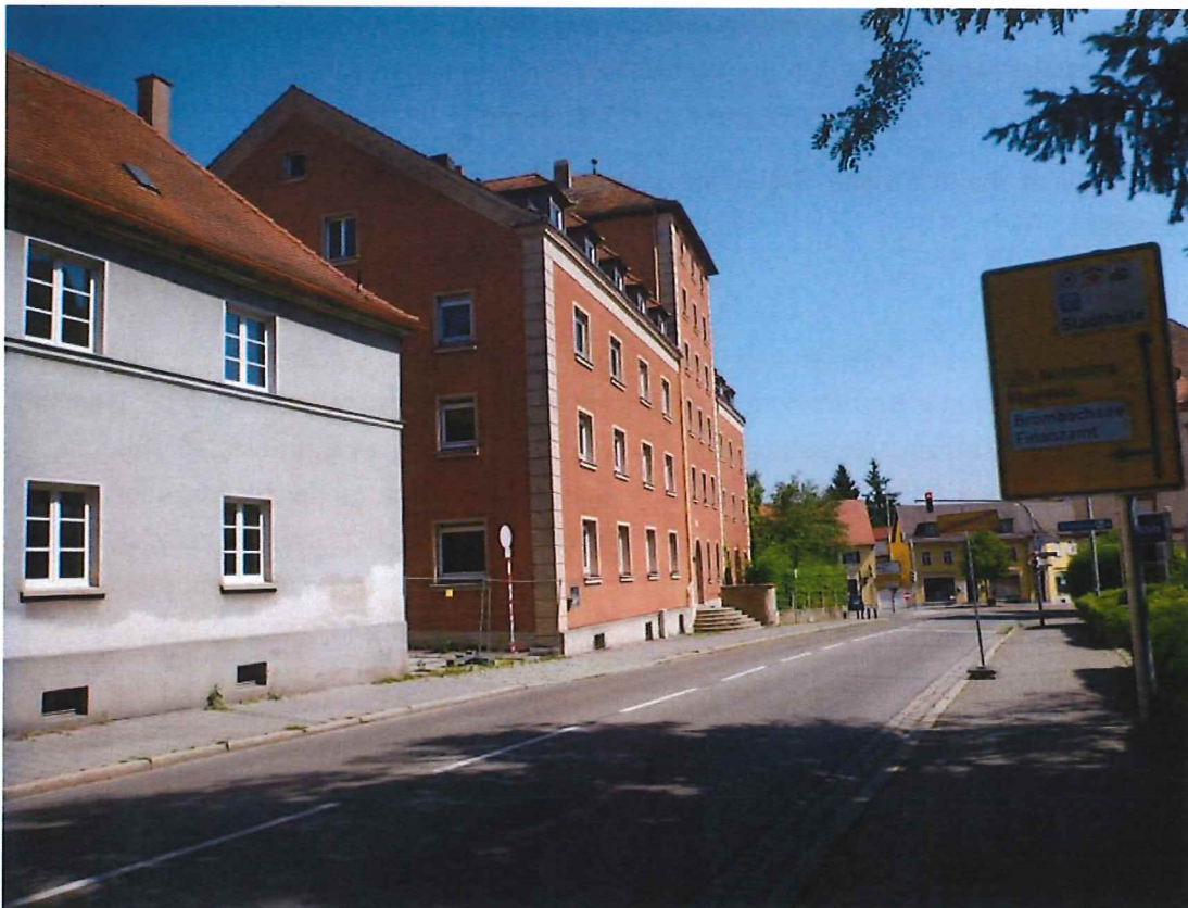
Abb. 8: Blick von der Bahnhofstraße Richtung Süden auf das Haus "Silo"