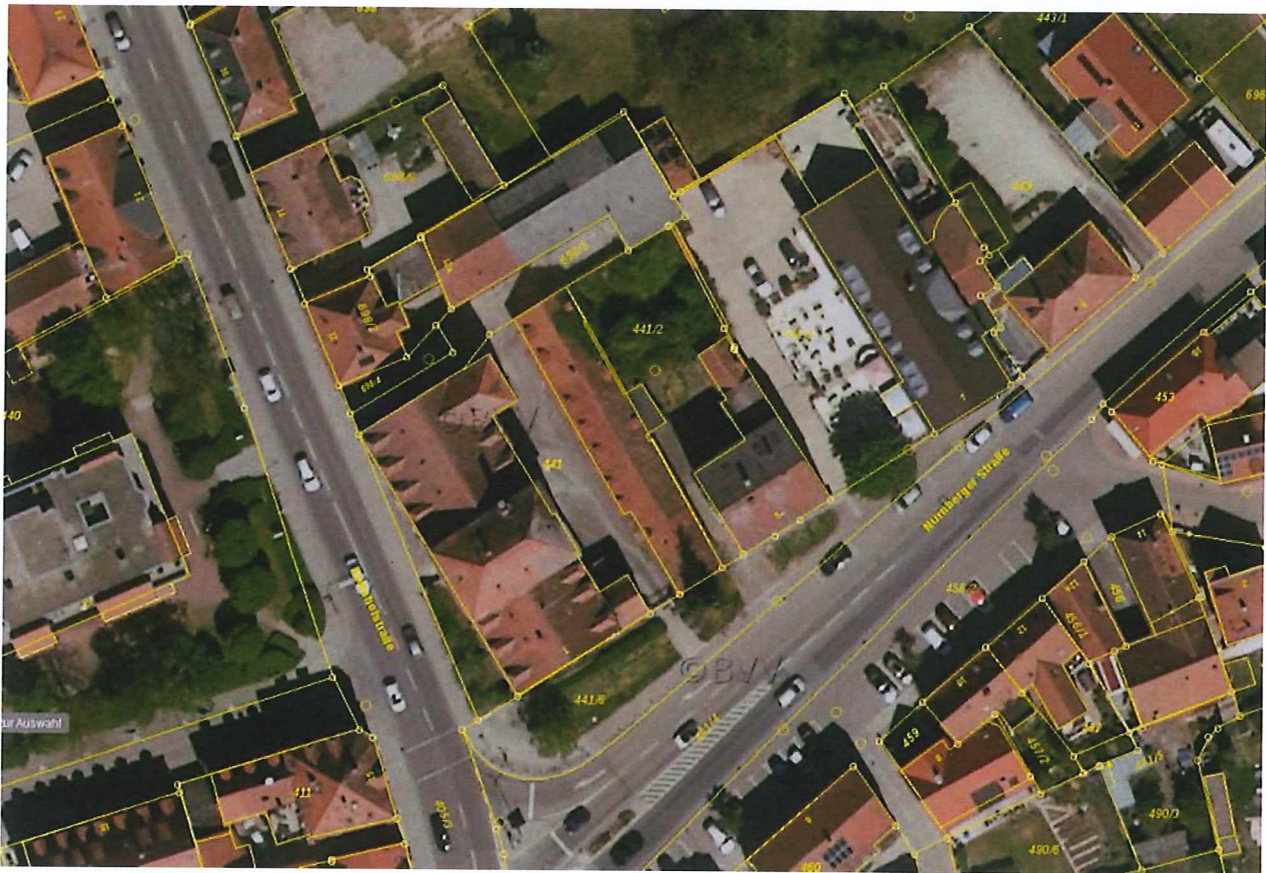
Abb. 4:Luftbild (BayernAtlasPlus)

Die Erhebung von Realnutzung und Vegetation wurde im Juni 2019 durch das Büro Ermisch & Partner, Roth durchgeführt. Kerngebäude des Geltungsbereiches ist das so genannte Haus "Silo", welches 1679 als Brauhaus erbaut wurde und mittlerweile leer steht.